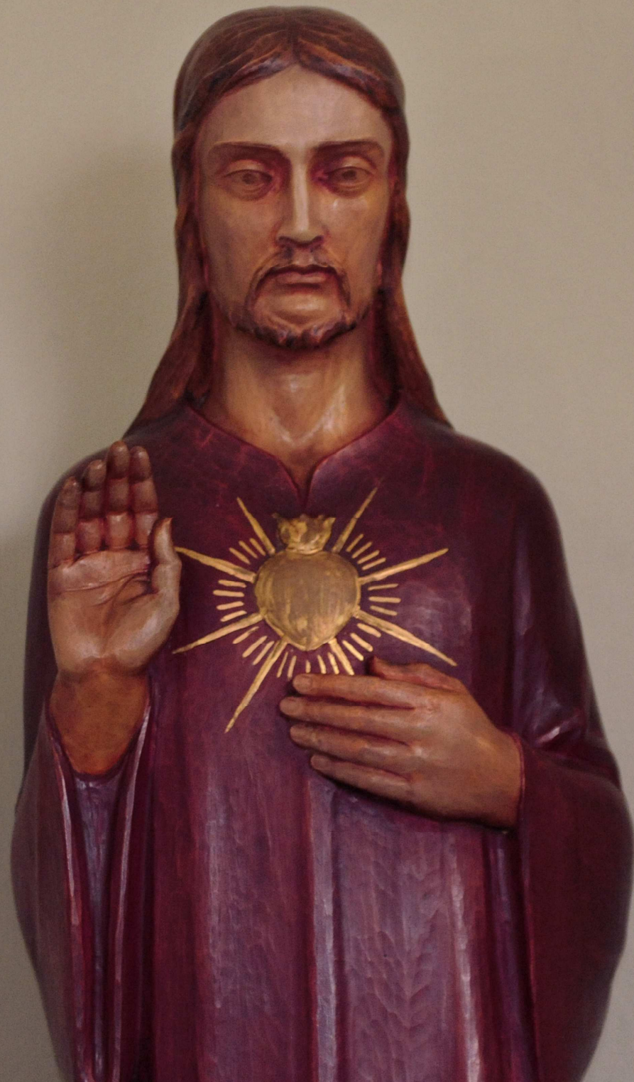
Herz Jesu, Kirche Aschbach; Fest Heiligstes Herz Jesu am 07.06.2024