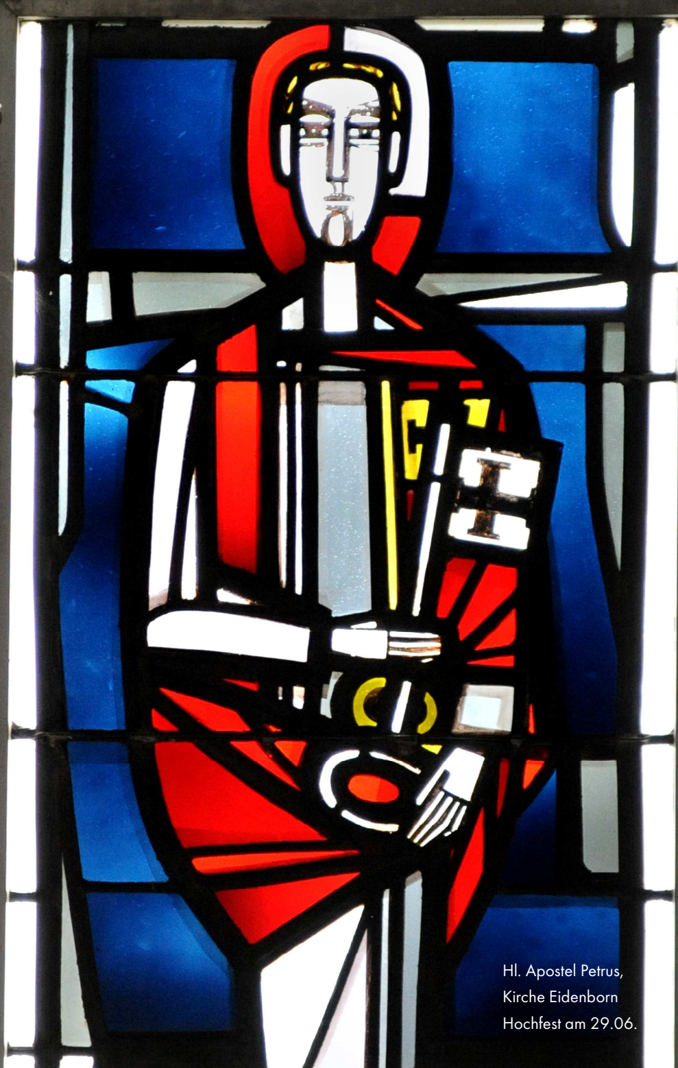
Hl. Apostel Petrus, Kirche Eidenborn Hochfest am 29.06.