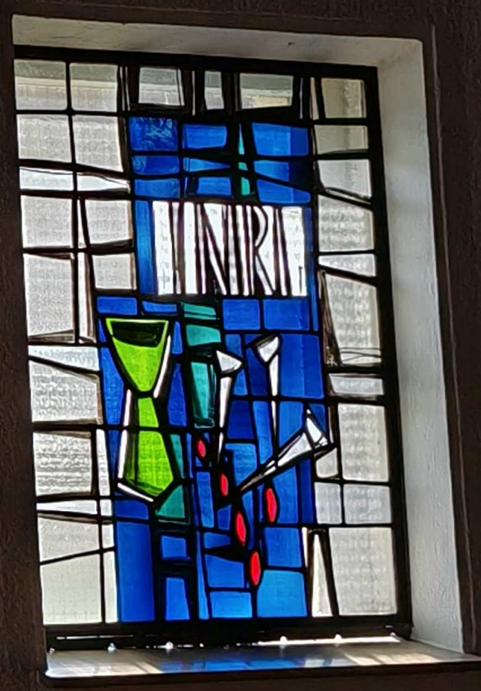
Passionsfenster, Pfarrkirche St. Stephan Schmelz-Bettingen