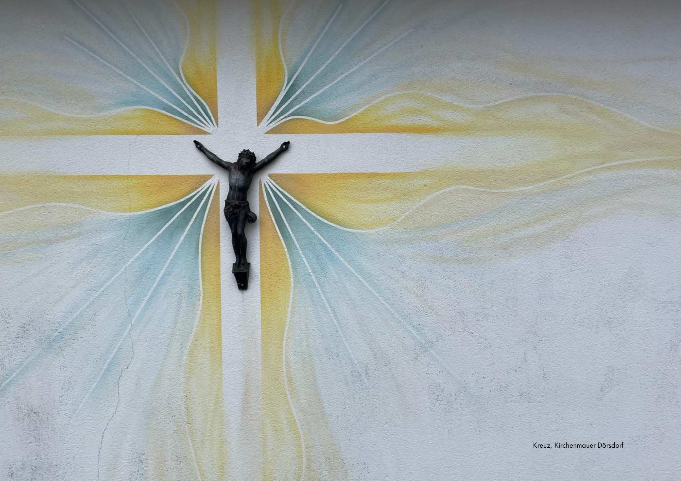
Kreuz, Kirchenmauer Dörsdorf