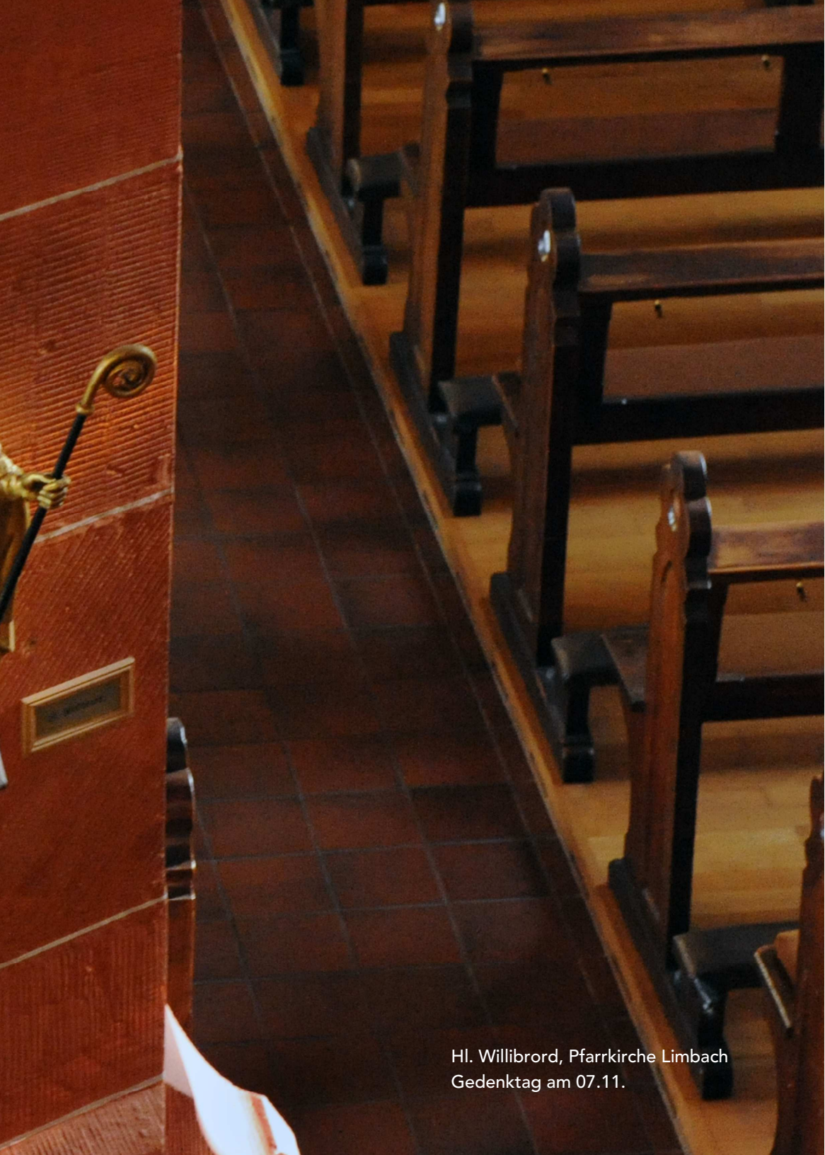
Hl. Willibrord, Pfarrkirche Limbach Gedenktag am 07.11.