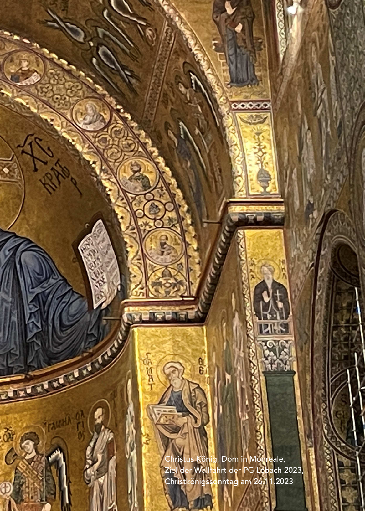
Christus König, Dom in Montreal, Ziel der Wallfahrt der PG Lebach 2023, Christkönigssonntag am 26.11.2023