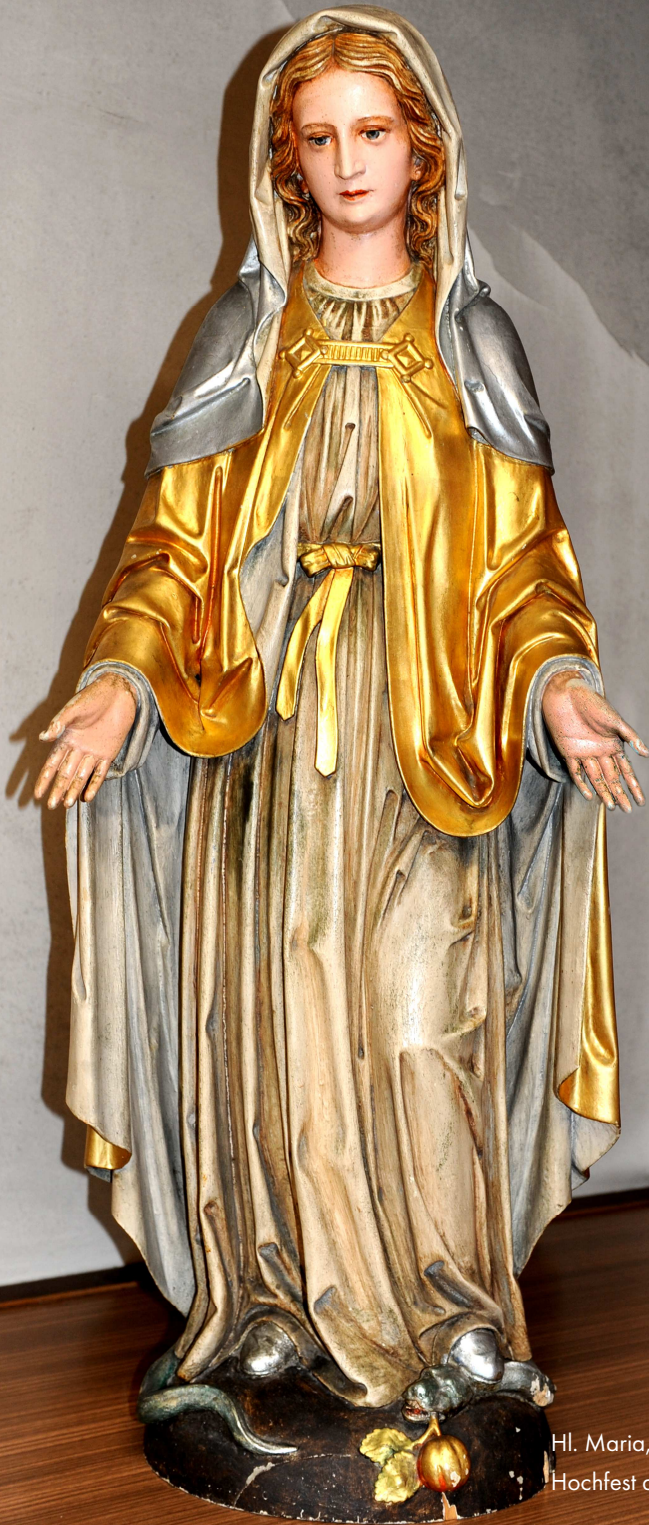
Hl. Maria, Kirche Thalexweiler Hochfest der Gottesmutter am 01.01.